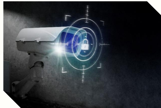
Zdalny Monitoring Wizyjny (analityka, sztuczna Inteligencja)