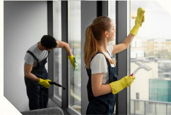
Usługi porządkowe (sprzątnięcie, czyszczenie)