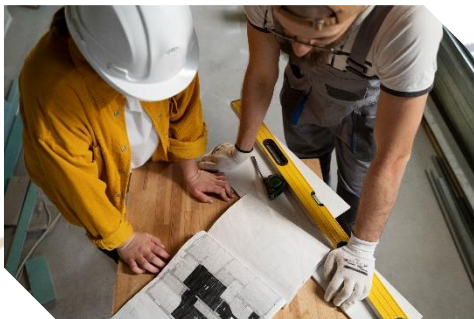
Budowa i Remont