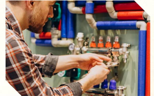
Usługi serwisowe (elektryka, hydraulika, inne)