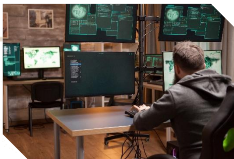
Stacje Zdalnego Monitorowania